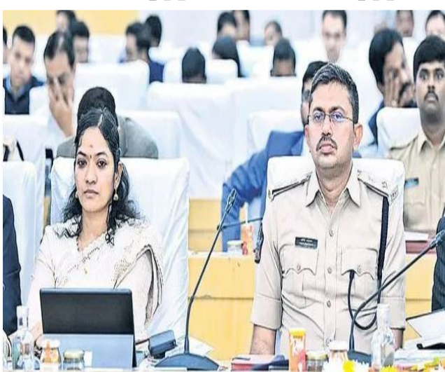
స్థాయి అధికారులు అవసరమైన చర్యలు చేపట్టాలన్నారు. జిల్లాలో వాట్యాప్ గవర్నెన్స్ లో వెనుకంజ వాట్యాప్ గవర్నెన్స్ లో జిల్లాలో ఆశించిన స్థాయిలో ప్రగతి సాధించలేదు. దీంతో రాష్ట్ర స్థాయిలో వాట్యాప్ గవర్నెన్స్ లో జిల్లాకు 28వ ర్యాంక్ వచ్చింది. జిల్లాలో మారుమూల ప్రాంతాలు అధికంగా ఉండడంతోపాటు అనేక ప్రాంతాలకు సెల్ టవర్లు ఏర్పాటు చేయాల్సి ఉంది. అలాగే మీకోసం ప్రజా సమస్యల పరిష్కార వ్యవస్థ కార్యక్రమంలో ప్రజల సంతృప్తి స్థాయి గత మూడు లేదా నెల రోజుల వ్యవధిలో నమోదు చేసినా 50 శాతం దాటకపోవడం గమనార్హం. దీంతో ఐపీఆర్ఎస్ ద్వారా సేకరించిన సమాచారం మేరకు ప్రజల సంతృప్తి స్థాయిలోనూ 28వ ర్యాంక్ వచ్చింది. మీకోసం కార్యక్రమాన్ని నెలరోజులకు ఒకసారి జిల్లా కలెక్టర్ ఆధ్వర్యంలో కలెక్టర్లలో, తర్వాత మూడు మార్లు ఆన్లైన్ నియోజకవర్గంలో నిర్వహించాలని సీఎం సూచించారు. ప్రధానమంత్రి జన్ మన్ యోజనలో భాగంగా జిల్లాకు 149 అంగన్ వాడీ కేంద్రాలకు భవనాలు మంజూరు కాగా వాటిలో 6 భవనాలు మాత్రమే నిర్మాణ దశలో ఉండగా.. ఇంకా 143 భవనాల నిర్మాణం ప్రారంభం కాలేదు. అలాగే జిల్లాలో వన్ స్టాప్ సెంటర్ నిర్మాణం సైతం పూర్తికాలేదు.