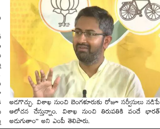
అడగొచ్చు. విశాఖ నుంచి బెంగళూరుకు రోజూ సర్వీసులు నడిపే ఆలోచన చేస్తున్నాం. విశాఖ నుంచి తిరుపతికి వంద కిలోమీటర్ల అడుగుతాం” అని ఎంపీ తెలిపారు.