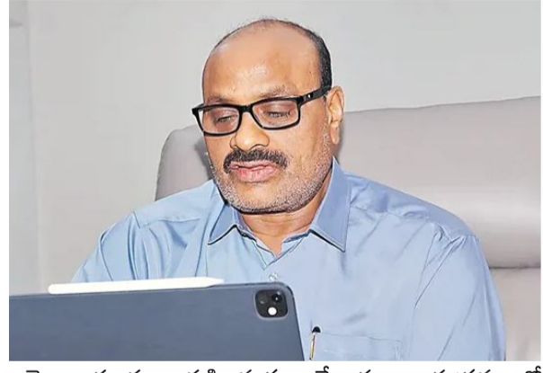
అచ్చెన్నాయుడు ఆసక్తి వ్యక్తం చేశారు. కార్యక్రమంలో వ్యవసాయశాఖ ఎక్స్ ఆఫీషియో కార్యదర్శి రాజశేఖర్, వ్యవసాయ, అనుబంధ శాఖల అధికారులు పాల్గొన్నారు.

అమరావతి: తీర అభివృద్ధిలో సింగపూర్ లోని ఆధునిక సమానాన్ని ఏపీలోనూ అమలు చేసే అవకాశాన్ని పరిశీలించాలని వ్యవసాయశాఖ మంత్రి అచ్చెన్నాయుడు అధికారులకు సూచించారు. రెండు దేశాల మధ్య వ్యవసాయరంగంలో సహకారం, పెట్టుబడుల అవకాశాలను మరింత బలోపేతం చేయాలన్నారు. వ్యవసాయ అధికారులతో కలిసి సింగపూర్ ప్రతినిధులతో వీడియో కాన్ఫరెన్స్ లో పాల్గొన్నారు. వ్యవసాయ రంగంలో గ్లోబల్ కనెక్టివిటీ, ఆహార భద్రత, సరఫరా వ్యవస్థ, సాంకేతికత వినియోగం, శీతల గోదాముల నిర్వహణపై చర్చించారు. ఏపీలో రైతులకు లాభసాటి ధరలు వచ్చేలా ప్రభుత్వం తీసుకుంటున్న చర్యల్ని మంత్రి వివరించారు. సింగపూర్ లో అమలు చేస్తున్న డేటా ఎనాలసిస్, యుటిలైజేషన్ విధానాలపై