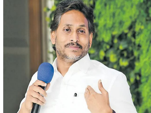
పార్కును 2023లో తెచ్చాం. దానికి రూ.వెయ్యి కోట్లు ఇచ్చేందుకు కేంద్రమూ ముందుకొచ్చింది. ఈ రెండేళ్లలో చంద్రబాబు అక్కడ ఒక్క అడుగు ముందుకు పడకుండా చేశారు. వైకాపా హయాంలో చేపట్టిన పోర్టుల్లో రామాయపట్నం 80%, మూలపేట 30%, మచిలీపట్నం 30% పూర్తయ్యాయి. ఈ రెండేళ్లలో వాటి పనులను ముందుకు కదలకుండా చేశారు' అని జగన్ ఆరోపించారు.

-గూగుల్, అదానీలనూ తీసుకొచ్చాను -అద్దంకి వైకాపా నాయకులతో సమావేశంలో జగన్ అమరావతి: మిత్తల్ స్టీల్ ను తానే తెచ్చినట్లు ముఖ్యమంత్రి చంద్రబాబు బిల్డ్ ఇన్స్ట్రూమెంట్ మాజీ ముఖ్యమంత్రి జగన్ విమర్శించారు. అద్దంకి నియోజకవర్గం వైకాపా ప్రజాప్రతినిధులు, నాయకులతో ఆయన తన క్యాంపు కార్యాలయంలో నిర్వహించిన సమావేశంలో మాట్లాడారు. '2022లో నేను దావోస్ కు వెళ్లినప్పుడు అక్కడ ఇదే మిత్తల్ వాళ్లు సన్ను కలిశారు. కర్నూలులో గ్రీన్ కో ప్రాజెక్టులో రూ.4,800 కోట్లు పెట్టేందుకు, ఎస్ఆర్ స్టీల్ ను కొని రూ.వెయ్యి కోట్లతో దాన్ని విస్తరించేందుకు నా సమక్షంలోనే ఒప్పందాలు చేసుకున్నారు. అదే సమయంలో ఉక్కు కర్మాగారం పెట్టాలని వారిని రాష్ట్రానికి నేను ఆహ్వానించా. నక్కపల్లిలో వారికి 2,200 ఎకరాలిచ్చేందుకు ఎన్నికల ముందే అడుగులు పడ్డాయి. అలోపు ఎన్నికల కోడ్ వచ్చింది. మేం అంతదూరం తెచ్చిన ప్రక్రియను చంద్రబాబు ఇప్పుడు పూర్తిచేసి, తనను చూసి మిత్తల్ వచ్చినట్లు బిల్డ్ ఇన్స్ట్రూమెంట్ అని విమర్శించారు. గూగుల్, అదానీలను తీసుకొచ్చింది తానేనని జగన్ తెలిపారు. '13 రాష్ట్రాలతో పోటీపడి నక్కపల్లిలో బల్బ్ డ్రగ్