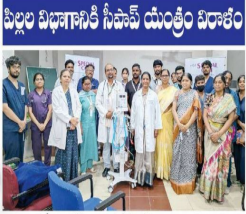
పిల్లల బిభాషాశక్తి గీతావేయంతో పాఠశాల...

చెవి నొప్పి, పన్ను నొప్పి వస్తే భరించడం కష్టమే. ఇక చెవి నొప్పి అయితే మరింత బాధ పెడుతుంది. కొన్ని సార్లు ఈ నొప్పి ఇలా వచ్చి అలా వెళ్లిపోతుంది.కానీ కొన్ని సార్లు మాత్రం రింగింగ్ అనే శబ్దం చేస్తూ ఇబ్బంది పెడుతుంటుంది. ఇలా మీకు వినిపిస్తే మీ చెవి ఇన్ఫెక్షన్ కు గురి అయినట్లే. అంతేకాదు మీ చెవిలో బ్యాక్టీరియా చేరినట్లే అని అర్థం చేసుకోండి. దీని వల్లనే ఇన్ఫెక్షన్ వస్తుంది. ఈ చెవి ఇన్ఫెక్షన్ ను ముందుగానే తెలుసుకొని ఇంట్లోనే కొన్ని చిట్కాలు పాటిస్తే సరిపోతుందట. ఇంతకీ అవేంటి అంటే..చేతులను శుభ్రంగా ఉంచుకోవాలి. వీటి ద్వారా బ్యాక్టీరియా, వైరస్ లు ఎక్కువగా వ్యాపిస్తాయి. ముక్కు నోటిని తాళాలి అనుకుంటే ముందుగా చేతులను కచ్చితంగా సబ్బుతో శుభ్రం చేసుకోవాలి. దగ్గినప్పుడు, తుమ్మినప్పుడు నోరు ముక్కు ను కూడా టిప్యూ తో అడ్డం పెట్టుకోవాలి. సమయానికి టిప్యూ దగ్గర లేకపోతే చేతులు అడ్డం పెట్టి చేతులు శుభ్రంగా కడుక్కోండి. ధూమపానం వల్ల చెవి నొప్పి వస్తుందట. దీని వల్ల యూ స్టేషియన్ ట్యూబ్ లను చికాకు పెడతాయి. దీని వల్ల చెవి ఇన్ఫెక్షన్ కు గురి అవుతుంది. పిల్లలకు న్యూమోకాకల్ టీకాలను వేయించాలి. దీని వల్ల చెవి నొప్పి రాదట. ఉన్నా కూడా తగ్గుతుంది. అంతేకాదు ఇన్ఫెక్షన్ తగ్గిస్తుంది ఈ టీకా. చిన్న పిల్లలకు క్రెస్టిన్ ఫీడింగ్ ఇవ్వడం వల్ల కూడా చెవి